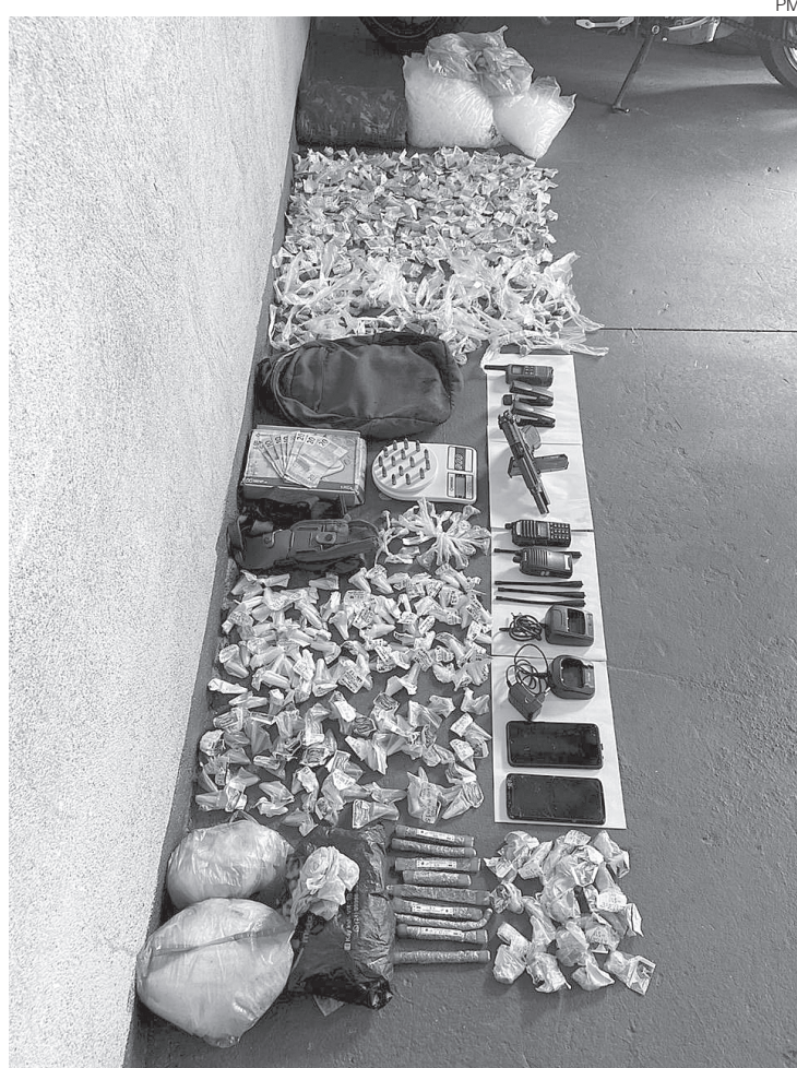
Material foi levado para a 93ª DP

Também foi apreendido farto material para endolção de drogas, 2.000 pinos vazios, R$ 150, dois grampeadores, dois celulares e uma mochila. Os suspeitos e o material encontrado pelos PMs foram levados para a Delegacia de Volta Redonda.