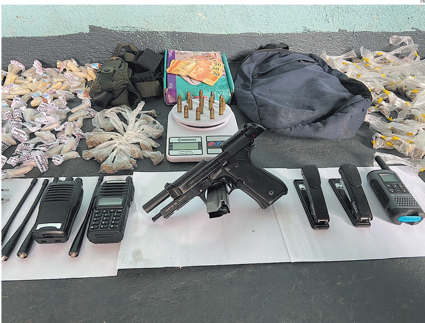
Material apreendido foi levado para a 93ª DP

Prisão aconteceu no Condomínio Ingá I e II, no bairro Santa Cruz, em Volta Redonda