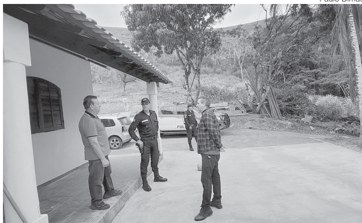
Iniciativa visa criar um esquema de patrulhamento intensificado na zona rural