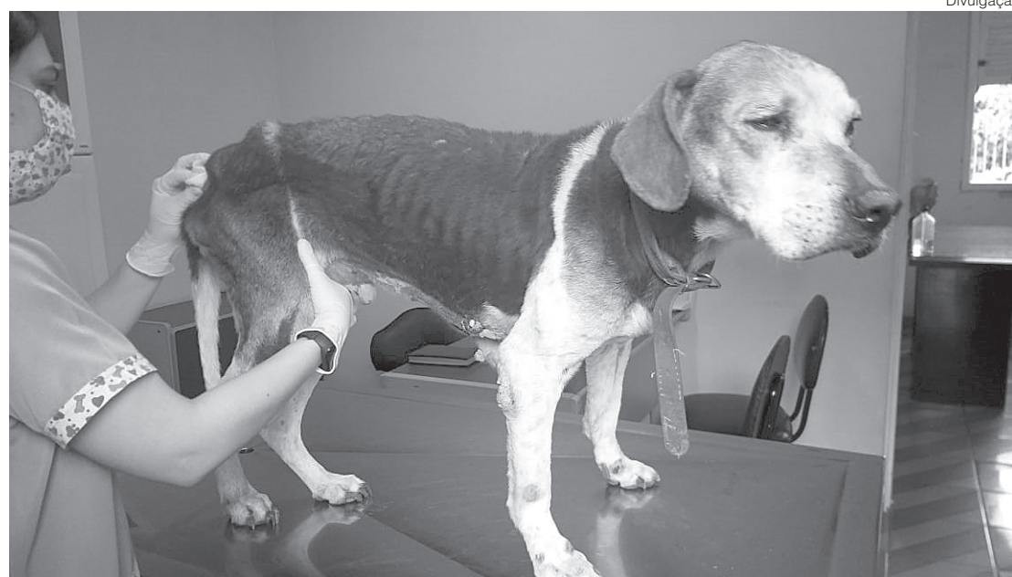
Volta Redonda: Homem foi intimado e pagará multa por cada animal lesado

que receberam as informações do programa Linha Verde, a denúncia mencionava que o animal era mantido preso e raramente recebia água e alimentação. Durante fiscalização no imóvel denunciado, a proprietária informou que o animal era de seu marido, que não se encontrava naquele momento.