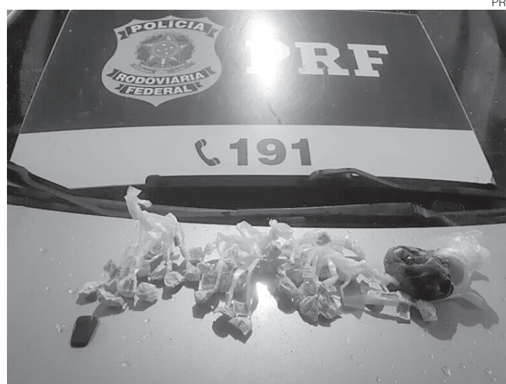
Material foi entregue na 94ª DP

Havia um saco cheio de pó de café, usado para tentar despistar o odor da droga caso fossem utiliza-