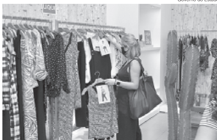
Segundo a Pesquisa Mensal de Serviços, o crescimento do setor no Rio de Janeiro foi de 5,4% em junho

Segundo a Pesquisa Mensal de Serviços, o crescimento do setor no Rio de Janeiro foi de 5,4% em junho. Em todo país, o avanço foi de 1,7%, em relação ao