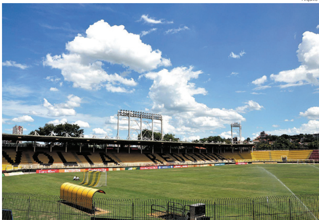
Primeiro será neste sábado, dia 14, às 17h, diante do Botafogo-PB