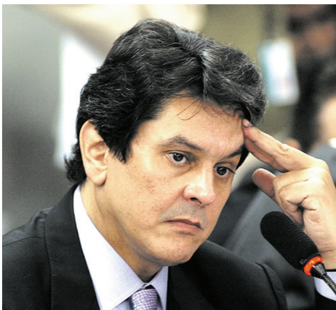
Mandado de prisão contra ex-deputado é preventiva, no qual não há prazo estipulado para acabar

O ministro do STF cita ainda um pronunciamento recente em que o presidente do PTB “novamente atentou contra a democracia”, sendo que seu discurso foi alinhado com o do presidente Jair Bolsonaro, com alegações sem provas sobre fraudes nas urnas eletrônicas e defesa do voto impresso, já declarado inconstitucional pelo STF. Moraes ressaltou o vídeo do discurso estava vinculado às redes sociais do PTB e foi amplamente divulgado. Nesse contexto, o ministro considerou que era “nítido objetivo de tumultuar, dificultar, frustrar ou impedir o processo eleitoral, com ataques institucionais ao Tribunal Superior Eleitoral e ao seu presidente”.