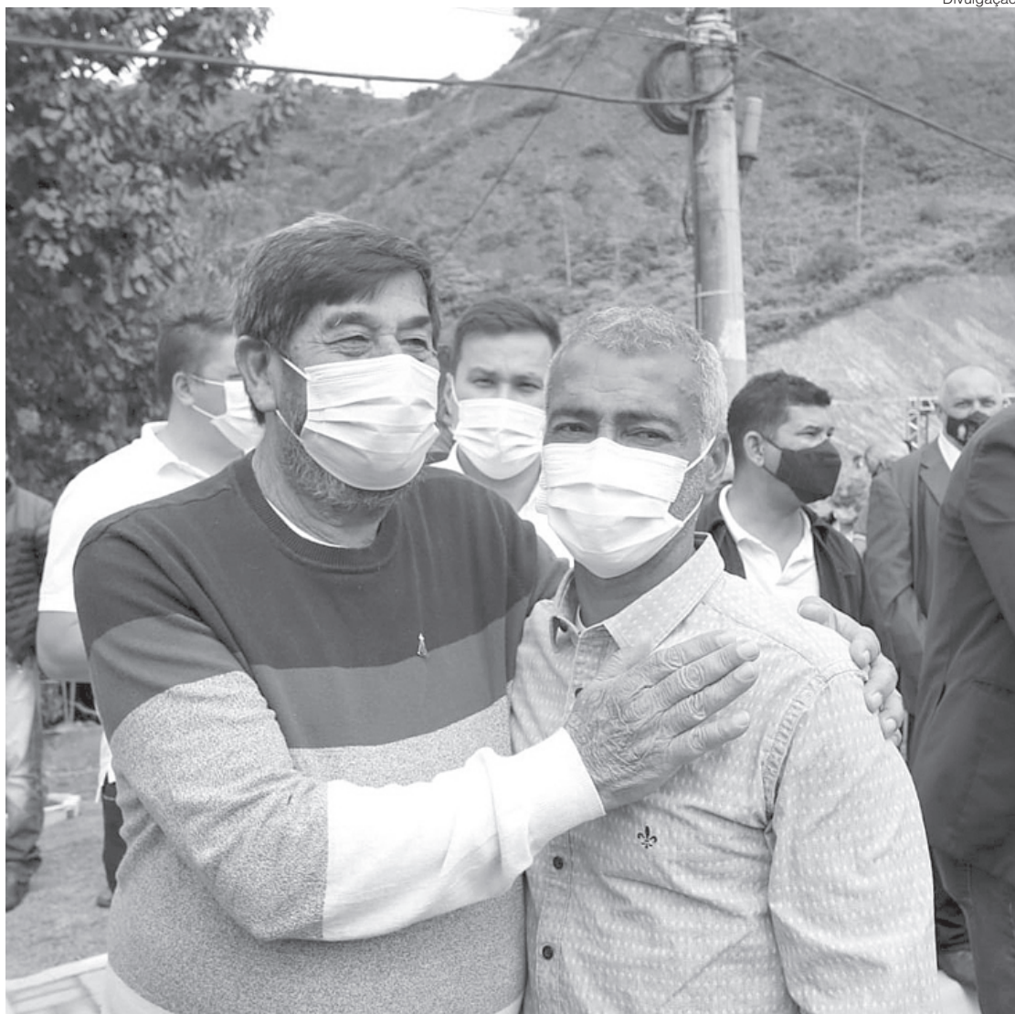
Romário e o prefeito de Rio Claro, José Osmar, durante visita

“O senador Romário é um parceiro dos municípios do interior e tem nos ajudado com recursos de emendas para a realização de projetos”, afirmou o secretário de estado de Turismo, Gustavo Tutuca.