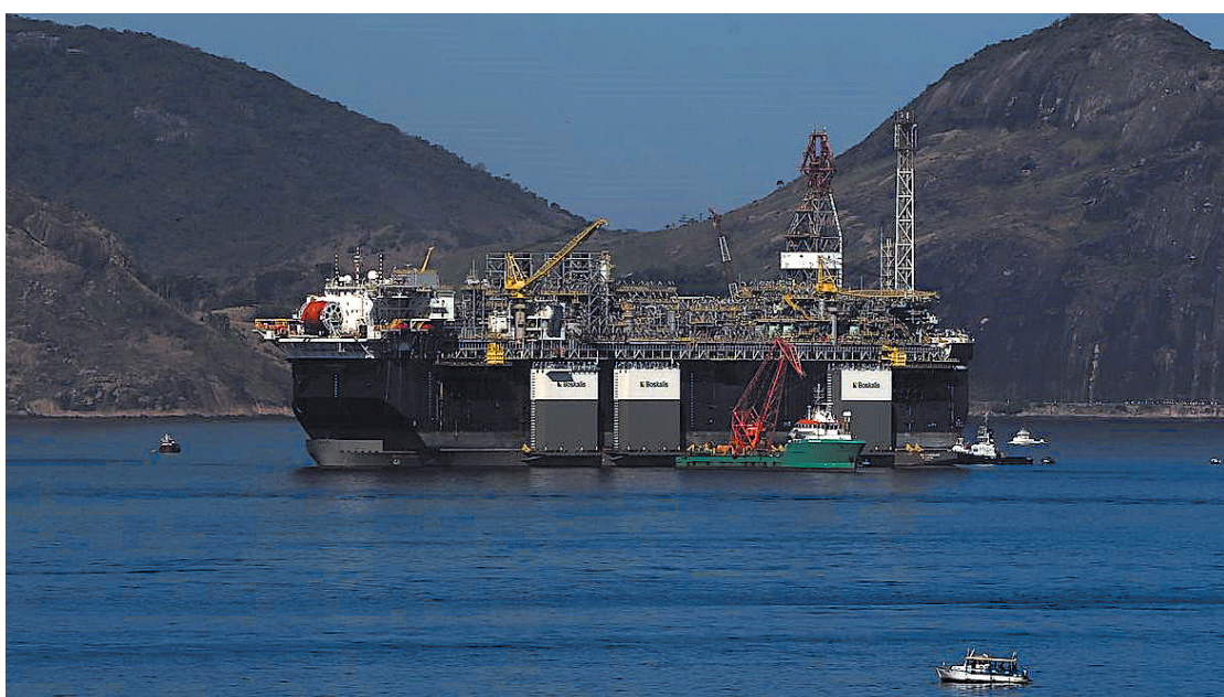
O total de barris de petróleo a que a União teve direito nos contratos sob o regime de partilha aumentou nos últimos meses

Contratos renderam à União 28,5 milhões de metros cúbicos de gás natural nos primeiros seis meses de 2021