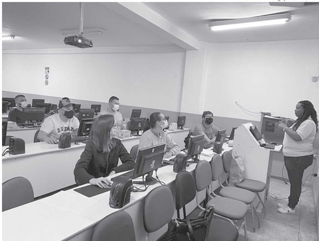
Alunos receberão uma espécie de bolsa de estudos para pagar menos